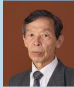
池原健二 国際シンポ運営委員長 奈良女子大学名誉教授 (日本)